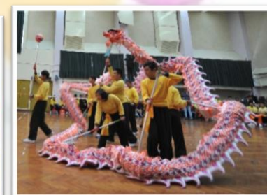
努力付出，勇奪男子拳術組金銀獎及龍藝銀獎佳績