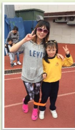
大手拖小手，二人三足，一家樂悠悠