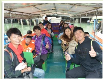
家長陪伴旅行真開心!