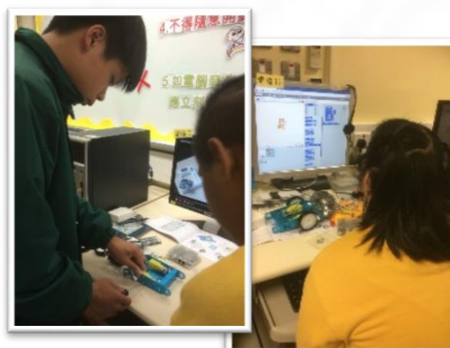
同學正聚精匯神地拼砌 mBot 機械人及進行編程學習

因應教育局對STEM（科學、科技、工程及數學）教學的推展，本學年無論在課程發展及課堂教學上均特別加入STEM的教學元素、內容及策略，更在中學班級增設「資訊及通訊科技科」。課程設計首要讓學生了解資訊及通訊科技與日常生活的關係，學習基本的應用軟硬體操作，以及運用網際網絡及使用資訊及通訊科技工具有效地解決日常生活的問題，並在不同的學科中引入體驗式及探究式學習活動，進一步培養學生運用邏輯思維的習慣，培育探索求真的學習精神。同時，亦運用教育局的撥款購買多元的教材教具，包括littleBits電子積木、3D打印機、mBot及SPRK機械人，期望藉此提升學生課堂的學習興趣及專注力，深化學習效益。