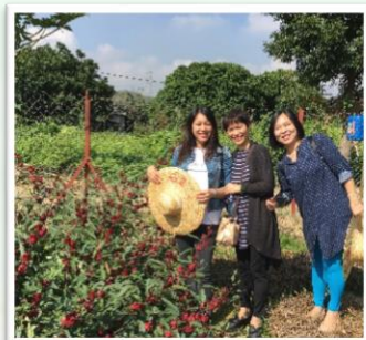
鬆一鬆，齊齊親親大自然