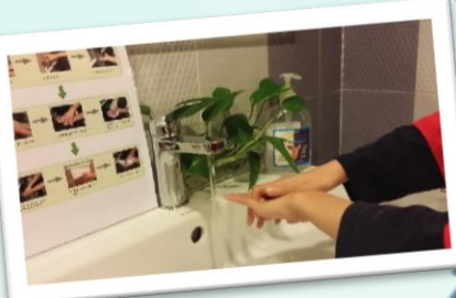
將法寶帶回家中延伸學習