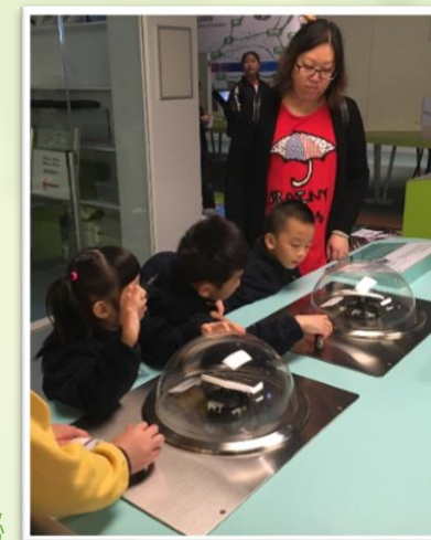
家長盡心盡力協助，探索生活的奧秘