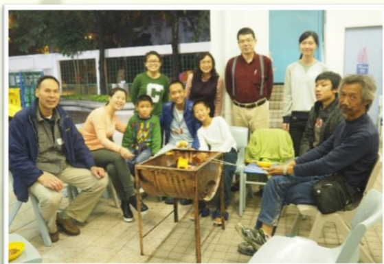
家長共聚，分享生活