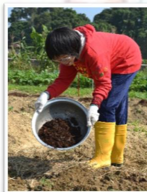
義工帶領同學移苗及添加堆肥