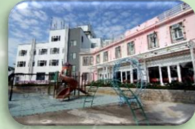
4月26-27日 明愛明暉營教育營