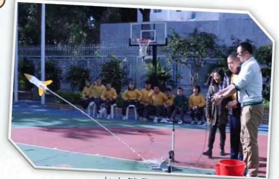
水火箭發射一刻 全場歡呼！