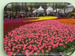
跟你的子女一同觀賞 2018 年度的香港花卉展覽