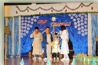
聖誕節日表演慶主誕生