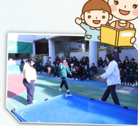
學生在老師指導下放船仔