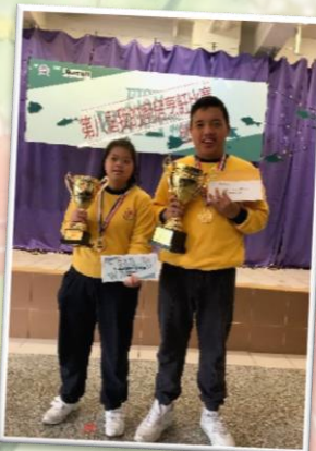
兩位得獎學生的合照