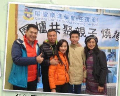
參與家庭與校長及舍監合照