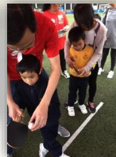
乒乓球發球 直接得分 YEAH!