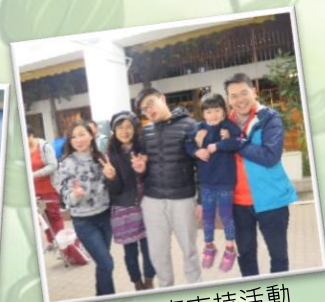
校長也來支持活動