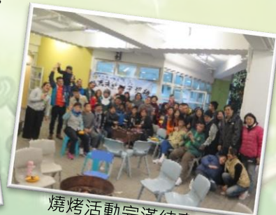
燒烤活動完滿結束