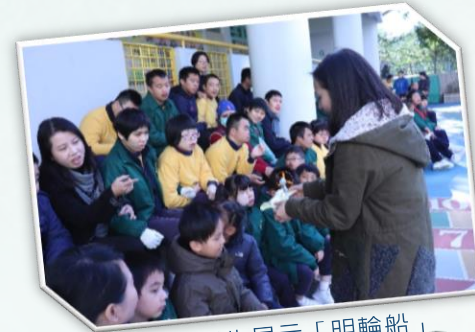
老師向學生展示「明輪船」

自學校推行 STEM 教學以來，「探究式學習活動」已成為每年恒常的科學探究活動。期望師生能在活動中一起尋找探究科學的樂趣，從而啟發學生對科學及科技知識的興趣，以循序漸進地培養學生的科學思維及學習技巧。今年以「水」作為探究對象，按學生的能力、年級分為四個階段，為學生設計一系列的活動，由淺入深地探索水的特性、用途等。更於 1 月 11 日的早會向全校師生推介活動，並讓學生即場參與活動，如：放船仔、肥皂泡等。而當中的「水火箭」、「水火箭車」等活動更大受歡迎，師生們見火箭升空的一刻都忍不住歡呼呢！