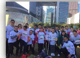
大功告成，活動順利完成

馬拉松猶如人生，重要的不是贏在起跑線，而是大家樂於進步，挑戰自己，故每年本校均有師生家長參與「奔向共融-香港特殊馬拉松」比賽，反應熱烈。是次活動除了期望提升學生及家長對健康及運動的認識，並且希望透過恆常練習，建立學生與公眾的融洽關係，加強家校、團體及公眾之間聯繫，建立以健康為本的網絡。