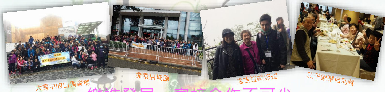
大霧中的山頂廣場