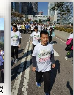
同心協力，盡力比賽