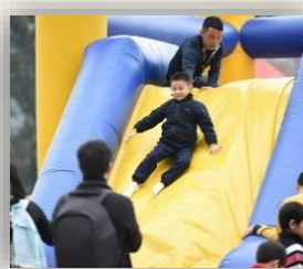
體驗速度 挑戰自己