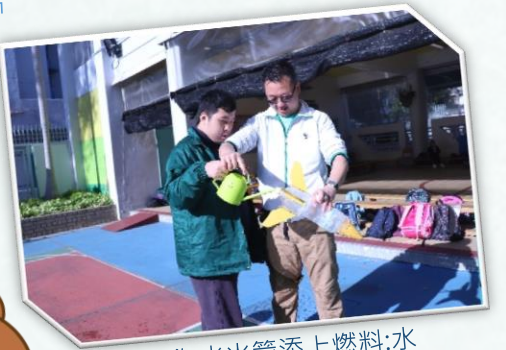
學生為水火箭添上燃料:水