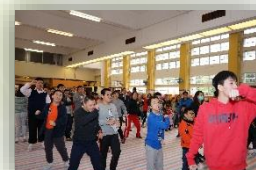
齊來舞動！歡欣躍動！