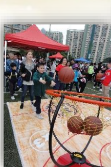
籃球初體驗 三分無難度