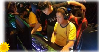
努力學習，成為電競選手