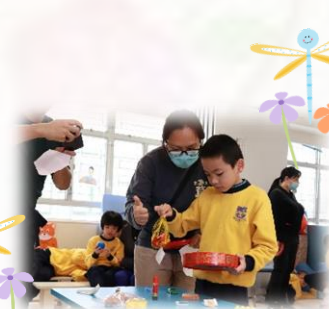
朱古力金幣當然同金盒有關