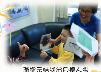
憑提示卡找出目標人物