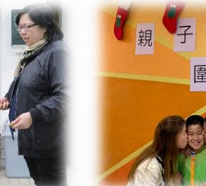
攝影溫馨親子一刻