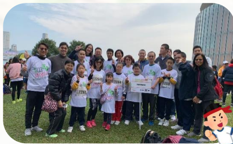
預備起跑，接受挑戰

本年度的東華三院「奔向共融」香港賽馬會特殊馬拉松已於二零二零年一月十二日進行，本校共有7位學生及家長參與。賽事圍繞中西區海濱長廊（中環段）及龍和道進行了公里的共融跑。晴空萬里之下，在一遍歡呼聲中，數以千計的參賽者及伴跑員，分組魚貫出發，各有不同目標，有人期望突破自己以往的成績，有人初試啼聲享受過程，有人親子同心舒展筋骨。3公里的比賽，學生及一起伴跑的家長及老師均樂在其中，在比賽中互相勉勵，雖然各有不同的步伐及速度，最後大家都順利完成比賽。比賽後，學生及家長也十分雀躍，表示難得週日可以參與這項有益身心的活動，期望下年也可繼續參與呢！