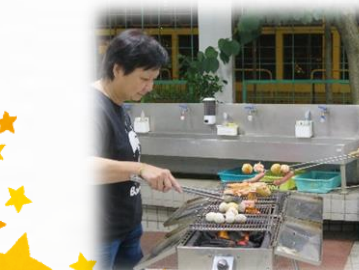
家長享用燒烤美食