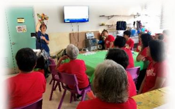
與老人院長者一起活動