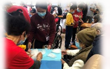
導師示範皮影偶的操作

學校本學年繼續獲社會福利署資助舉辦「老有所為活動計劃」，本年度活動以皮影戲為主題，由專業導師教導學生和長者義工一同學習和操作具中國傳統文化的皮影藝術，將神創造天地宇宙的聖經故事搬上舞台螢幕，透過皮影戲和歌舞表演，為區內長者和幼兒帶來歡樂，亦藉此宣揚天父的愛，發揮長幼共融精神。家長和同學們，如希望觀賞或重溫精彩的皮影戲表演，請留意下學期的演出時間。