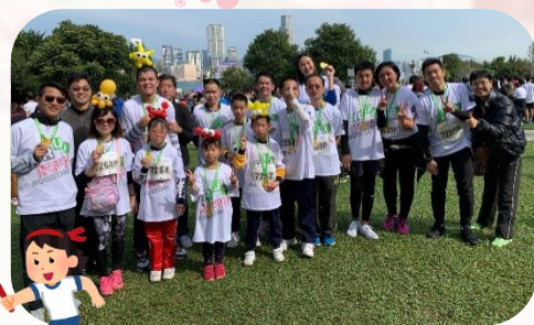
堅毅努力，完成賽事