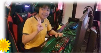
電競運動，樂在其中