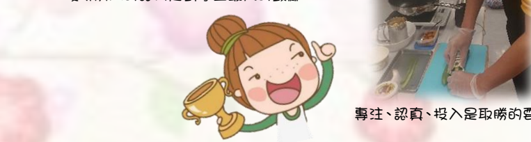
專注、認真、投入是取勝的要素