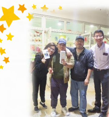
家長積極參與活動