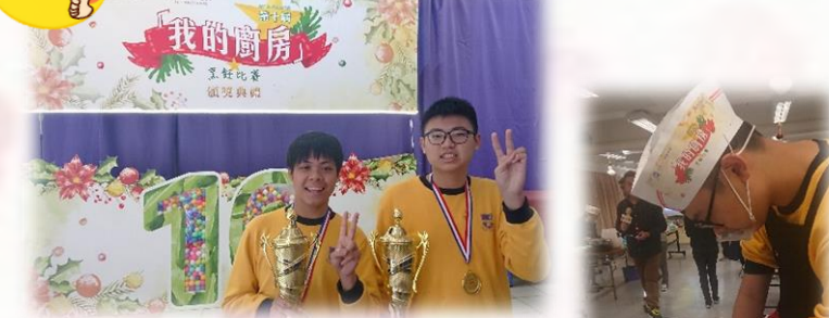
獲得別人的認同是對學生最大的鼓勵