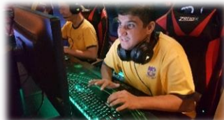
電競世界，不分國界