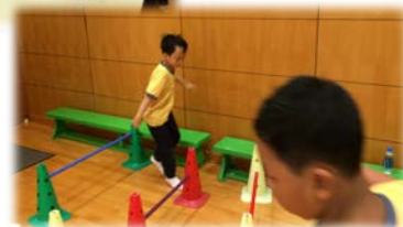
▶ 藉遊戲增強學生對圖形空間概念的認識