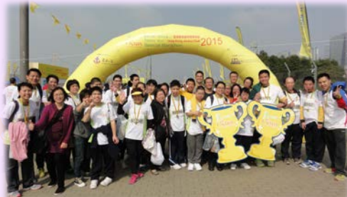
▲ 奔向共融「香港賽馬會特殊馬拉松2015」

透過多元化的體育活動，提高學生對體育運動的投入感和興趣。加強他們對不同運動項目的認識，並希望令體育運動成為他們生活的一部份。另在體育、運動及康樂方面展示不同的共通能力，如溝通能力、協作能力及審美能力，並應用至生活其他方面。