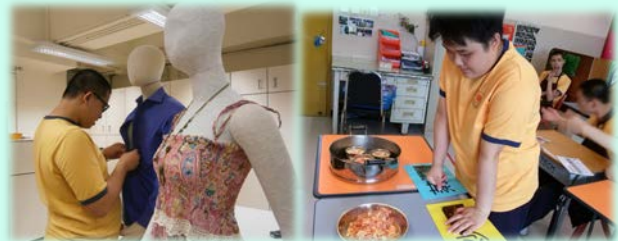
▲ 學習配襯服飾 ▲ 學習選擇健康的烹調

以「衣」和「食」兩方面作為學習的基礎，以提升獨立生活及自我管理能力和建立和諧的家庭關係。