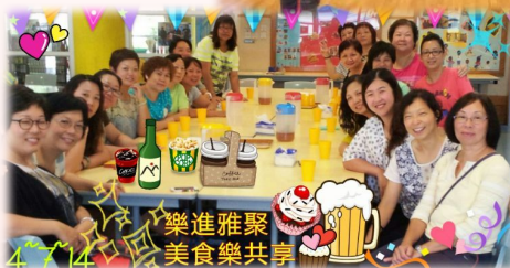
樂進雅聚 美食樂共享